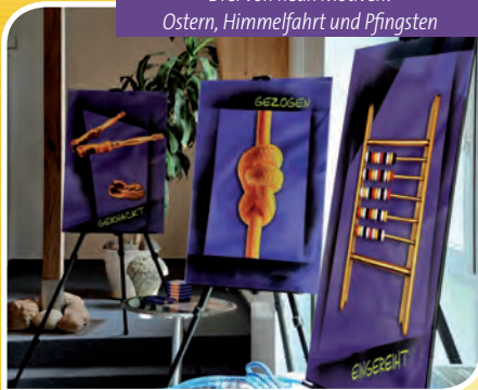
Drei von neun Motiven: Ostern, Himmelfahrt und Pfingsten