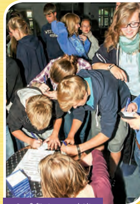
Spaß für Jung und Alt

Fertig ausgearbeitete Stundenentwürfe können genutzt werden. Ausstellungsmotive stehen für den Unterricht auch im A3-Format und als PowerPoint zur Verfügung.