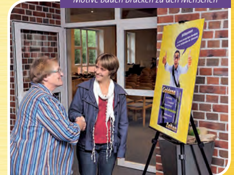
Motive bauen Brücken zu den Menschen