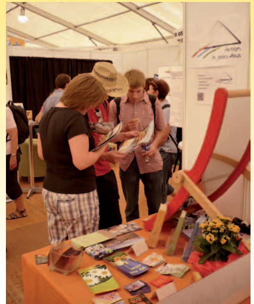
Teil der Infostandauslage

Nun hoffen wir, dass alle weitergegebenen Schriften an den Menschen weiterwirken, zu einem aktiven Christsein und zur Hingabe an Gott führen.